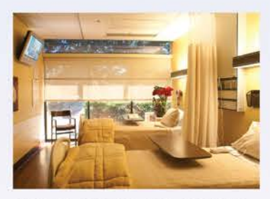
SVH SE ASOCIA CON ENSIGN GROUP para mantener el Centro de Enfermería Especializada dentro del hospital.