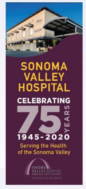
El HOSPITAL celebra su 75º aniversario.

completa una exitosa campaña de capital de $21 millones para financiar la construcción del Centro Ambulatorio Diagnóstico.